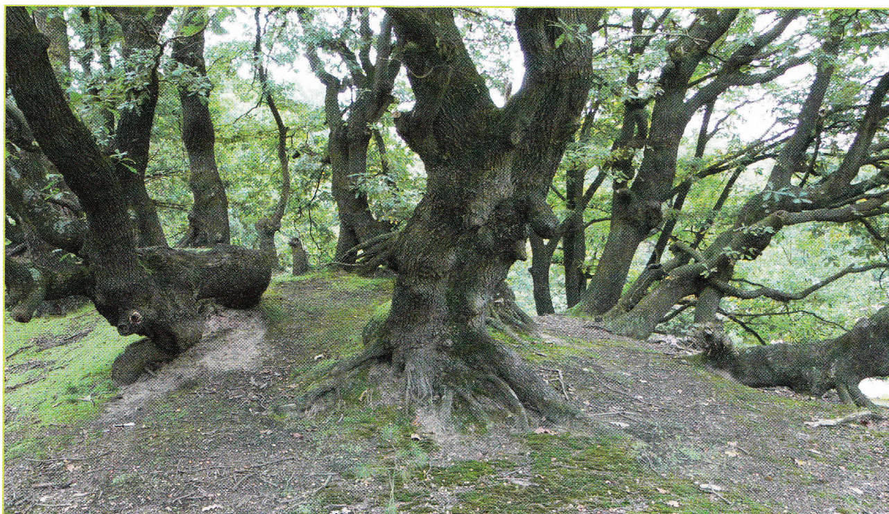
Figuur 5: Net als de Warande in Wetteren is Klaverberg te As een erkende zaadbron: kwekers oogsten eikels en produceren plantsoen dat op de markt komt.

In de Kempen zijn er nog verscheidene locaties met resten van oud hakhout van zomer- en wintereik: Klaverberg en Kruisberg in Opglabbeek, Windelsteen en Opgrimbie in Maasmechelen, Langenberg in Lanaken, militaire domeinen en gemeentebos in Hechtel. Ook vermeldenswaardig zijn omvangrijke stoven van es, gewone vogelkers