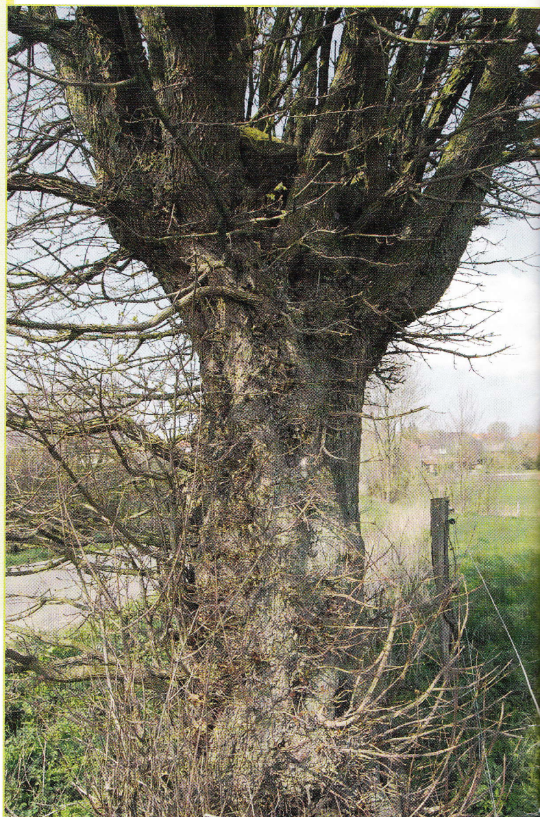
Figuur 1: Heuvelland is de kampioen in knotbomen: wilgen, eiken, zwarte elzen, haagbeuken, Spaanse aken (foto), essen en zelfs een enkele hazelaar.

KRISTINE VANDER MIJNSBRUGGE, ARNOUT ZWAENEPOEL, BART OPSTAELE & BERT MAES