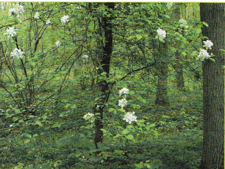
Figuur 4: Wilde appel kan slechts overleven in lichtrijke omgevingen.