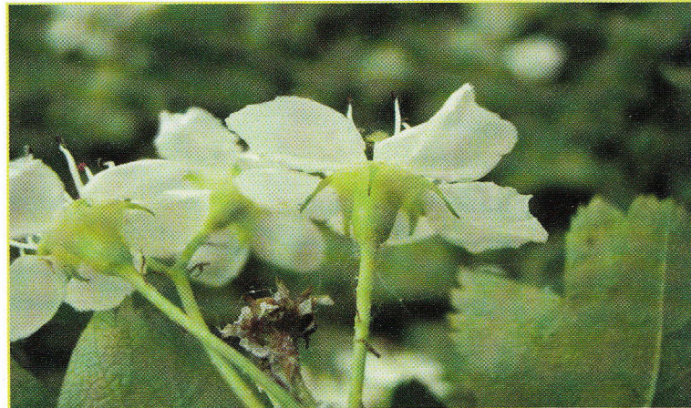
Figuur 7: Koraalmeidoorn op het plateau van Kaastert met scherp getande bladrand en opvallend lange kelkbladeren.

van Kaastert, staat een vrij klein doch uiterst soortenrijk bosje. Tussen de eenstijlige meidoornen ontdekten de inventariseerders in 2001 de voor Vlaanderen uitgestorven gewaande koraalmeidoorn (Fig. 7). Aan de oostkant van het bosje groeit een tweestijlige meidoorn met drie stijlen, dus telkens drie pitten per bes. Enkel hier en in Voeren komt de zeer zeldzame rode kamperfoelie voor. Deze is geen klimmer, zoals de algemeen voorkomende wilde kamperfoelie, maar een klein struikje in de onderetage van het bos.