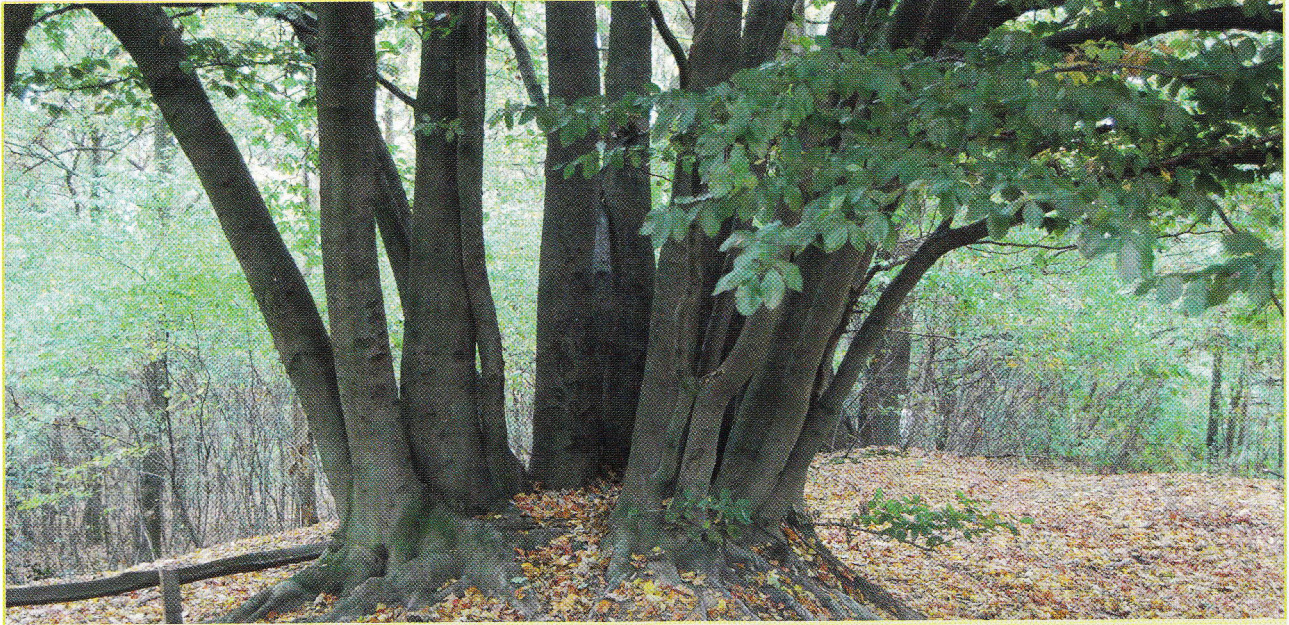
Figuur 2: Een uiterst zeldzaam beeld in de Lage Landen: relict van beukenhakhout in de Warande (Wetteren).