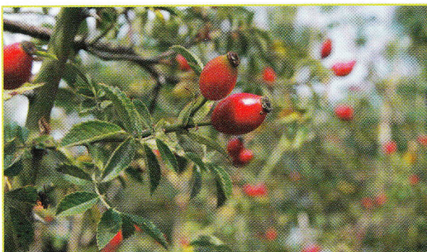
Figuur 6: Kraagroos behoort tot de egelantieren en heeft naar appel geurende blaadjes.

In het zuiden van Limburg is het Plateau van Kaastert te Riemst dé toplocatie. Hier groeit in de houtkanten een opvallende diversiteit aan rozen met o.a. viltroos, kleinbloemige roos en kraagroos (Fig. 6). De laatste is een uiterst zeldzame egelantier en komt enkel in de regio van Haspengouw en Voeren voor. Bovenop het plateau