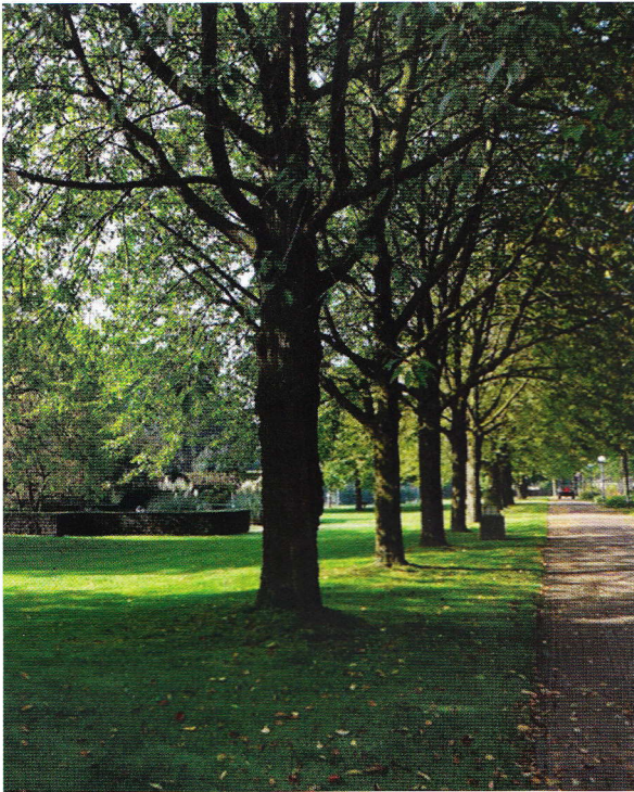
Nieuwe oost-west as.

van Summeren in samenspraak met de bevolking. Daarbij zijn de historische waarden gerespecteerd.