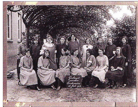
Geslaagde leerlingen in 1924 onder perenberceau.