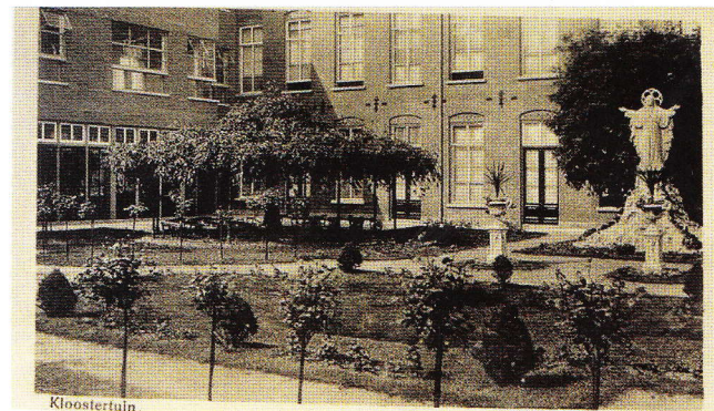
Kloostertuin met tuinrichting van omstreeks 1900-1920 met prieel- en al volwassen toestand.

de oorlog. Na de Tweede Wereldoorlog verdwenen de agrarische nutsfuncties geleidelijk. De weilanden werden sportterrein voor de school en de tuinen werden ingericht als verblijfs- en wandeltuinen. Er verscheen ook een bosje in het natste deel langs de voormalige Korvelse waterloop.