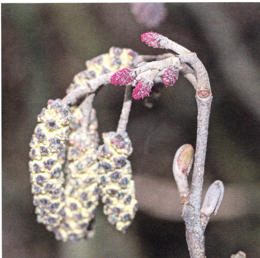
Zwarte els, Alnus glutinosa , behoort tot de berkenfamilie en heeft vergelijkbare bloeiwijzen. De boomsoort bloeit in februari-maart. De kleine vrouwelijke katjes zijn vuurrood.

Anders wordt het bij bloemen van onder meer de eik, beuk, hazelaar, berk en de els. Deze zijn eenslachtig, de mannelijke en vrouwelijke bloemen zitten apart van elkaar in een boom. De boomsoort kan ook tweehuizig zijn, waarbij de vrouwelijke en mannelijke bloemen in aparte gescheiden bomen voorkomen, zoals bij de es, wilg en populier. Ook zijn