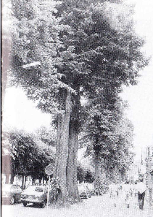
De Lind in Oisterwijk, de lindenrijkste gemeente in Brabant

praktisch verdwenen. Dit geldt trouwens ook voor heel ons land. Een voorbeeld van jonge linden in bosverband is te zien in het Liesbos in Breda, als ondergroei van eikenaan-