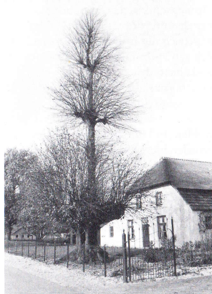
Etage-linde in Beers

terstandsverlaging bij bouwwerkzaamheden kunnen daar aan toegevoegd worden. Gezien de zeer hoge leeftijd die de linde kan bereiken hoeven we niet zo gauw bang te zijn dat een boom aan zijn einde is. Er zijn ook geen ziekten die echt bedreigend zijn, zoals bij de iep. Toch wordt er bij parken en landgoederen dikwijls veel te snel aan verjonging gedacht, juist als de bomen karakter gaan krijgen en holten in de stam gelegenheid geven aan vlermuizen en boombewonende vogelsoorten. Een linde stelt weinig eisen, maar het is wel zaak te letten op de groeiomstandigheden. Bodemverdichting en aanrijshade zijn de grootste problemen. Om die redenen is de monumentale linde van Terheijden omgezaagd en