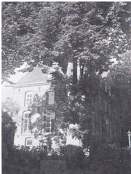
De linde van Nemerlaer

Wij zijn van mening dat het vrijstellen van deze boom mede heeft veroorzaakt dat hij thans op het lijstje van de toptien van lindebomen is opgenomen.