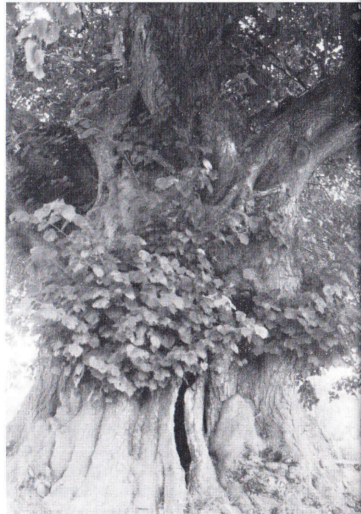
Linde in Sambeek. Oudste boom en linde van ons land, ca. 450 jaar

Hier treffen we ook wel andere soorten aan, buiten de oorspronkelijke Winter-, Zomer- en Hollandse linde, zoals de Krimlinde, Zilverlinde en Amerikaanse linde. Ook bijzondere gekweekte variëteiten komen wel voor zoals in het Helmondse kasteelpark, met een Laciniata-vorm van de zomerlinde met ingesneden bladeren. Als opmerkelijke parken noemen we hier het Anton van Duinkerkenpark in Bergen op Zoom van tuinarchitect L. Rosseels, het Wilhelminapark van L.S. Springer en Valkenberg in Breda