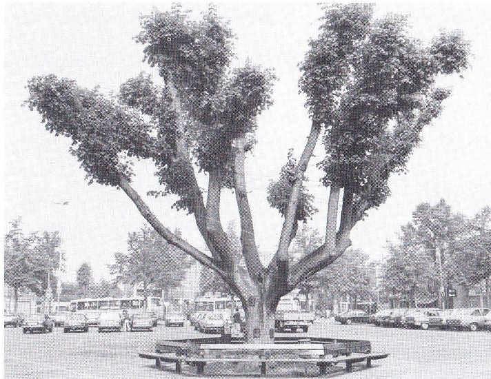
Etageline in Uden