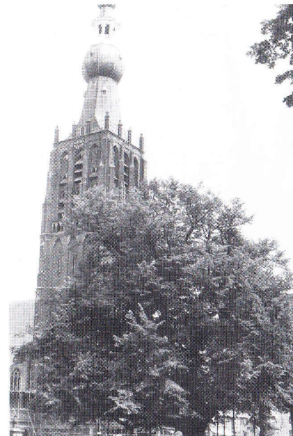
Etagelinde op het Vrijthof te Hilvarenbeek, met 15e eeuwse toren

Een oudere traditie hebben de landgoederen. Brabant is zeker niet rijk aan landgoederen, integendeel. Toch zijn een aantal buitens aan de benedenloop van de Essche Stroom en Dommel nabij 's-Hertogenbosch bijzonder te noemen met name vanwege de monumentale bomen. 18de-, mogelijk nog 17de-eeuws zijn de dikke en hoog opgaande lindes van kasteel Nemerlaer, het voormalige seminarie Haarendael in Haaren, en Zegenwerp in Sint-Michiëlgestel. Een prachtige