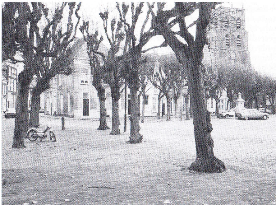
Geertruidenberg met dubbele rij linden op het Marktplein. Op achtergrond 14 e eeuwse H. Geertruidkerk

Uit stuifmeelonderzoek in de bodem blijkt dat de linde in het verleden altijd in onze bossen heeft thuis gehoord. Het hoogtepunt was in het Atlanticum (ca. 5000-3000 v.Chr.). Daarna heeft de linde het bos met meer andere boomsoorten moeten delen. Ook uit vele lindetoponiemen is op te maken dat deze boomsoort op talrijke plaatsen gestaan moet hebben (b.v. Lijndonk onder Bavel, Lijnsheike in Tilburg en Lijnt in Bergeyk).