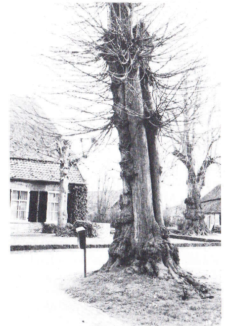
Het gehucht Boomen, onder Someren. Een gave boerderijnederzetting met eeuwenoude linde

zijn hier in enkele rijen geplant. Ook dorpsstraten met lindebeplanting kunnen sfeerbepalend zijn. Voorbeelden daarvan zijn Leur met de Korte en Lange Brugstraat, Terheijden, Udenhout, het al genoemde Oisterwijk met diverse rijkbeplante straten, Reek nabij het 18de-eeuwse huis van de bekende orgelbouwersfamilie Smits en de Dorpsstraat van Luyksgestel. Onder Boxmeer bij Beugen is een straatweg fraai beplant met zilverlindes, die eigenlijk niet tot de oorspronkelijke lindesoorten gerekend kunnen worden. Op het landgoed Groot Molenbeek onder Bergen op Zoom staat een zeldzaam