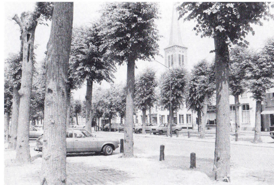
Het fraaie dorpsplein in Etten met snoeilindes. De neogotische kerk van architect van Genk op de achtergrond

Overgenomen uit: Monumenten, jaargang 10, nummer 3/4, maart/april 1989.