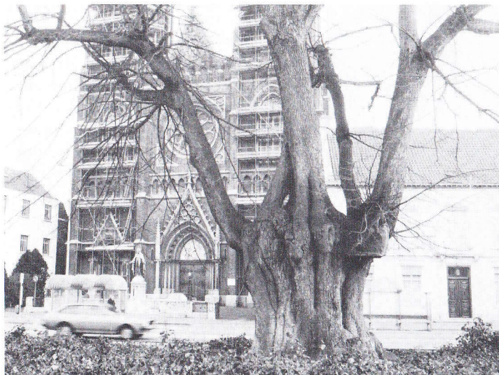
Etageline in Tilburg

exemplaar bij boerderij IJzer Hek te Breda. Meestal worden deze bomen veel ouder geschat dan ze in werkelijkheid zijn. Duizend jaar is zelfs niet ongebruikelijk! In feite zijn ze meestal zo'n 250 à 350 jaar oud.