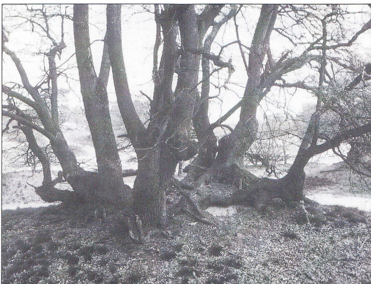
Zeer oude stoof van de zomereik in de Loonse en Drunense Duinen (Natuurmonumenten); vermoedelijk uit de vroege Middeleeuwen

Oorspronkelijk inheemse of autochtone bomen en struiken zijn veelal zeer schaars en behoren zelfs tot in Nederland bedreigde organismen. Een groot deel komt als soort veelvuldig voor maar daarvan is genetisch gezien weinig van autochtone herkomst. Naar schatting is meer dan de helft van de houtige gewassen van autochtone herkomst zeldzaam of bedreigd. Alleen al in de afgelopen eeuw zijn zo'n driekwart van de oude bosgroeiplaatsen en houtwallen in ons land gekapt. Dat zijn nu juist de belangrijkste autochtone genenbronnen. Ook daarvoor, vooral