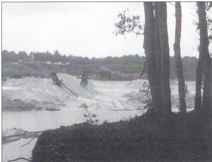
Een van de allerlaatste populaties van de wintereik in Drenthe, bedreigd door zandafgraving

na het vertrek van de Romeinen tot ca 1600, was er al een periode van steeds intensievere exploitatie en verarming van het bos.