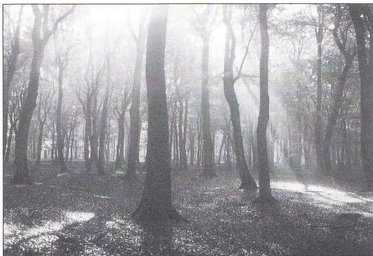
Het Elspeeterbosch met zeldzaam voorbeeld van autochtone beuk

Verreweg het grootste deel van onze oudste bossen is in aanleg hakhoutbos, of bos waarbij het hakhout 'op enen' is gezet; de zgn. spaartelgen. Oud opgaand bos, hudewald en middenbos is in ons land zeer schaars. We zien ze hier en daar op de Veluwe en in de Achterhoek rond Winterswijk. Het gaat daarbij zowel om gemeenschappelijke malebossen als particuliere bossen. Uit archieven is bekend dat voor heraanplant van eiken in het Edese bos en het Meerdinkbos bij Winterswijk eikels werden verzameld uit het bos zelf of uit de omgeving (Maes, 1994). Onbedoeld werd zo autochtoon genetisch plantmateriaal behouden. Zonder uitzondering zien we in dergelijke opstanden Wintereik en de hybride met Zomereik (Quer-