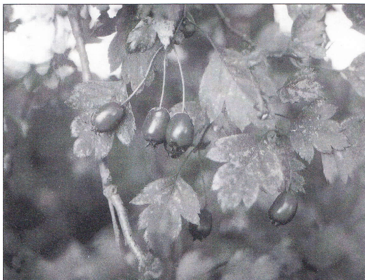
Hybride van de Koraalmeidoorn en de Tweestijlige meidoorn, in de omgeving van Roden in Drenthe

Wat is nu eigenlijk het belang van autochtone bomen en struiken?