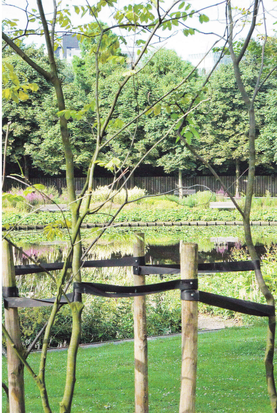
De vasteplantenborder rond de vijver werd aangelegd voor de Floriade van 1972.

De gemeentelijke monumentenstatus van het Beatrixpark richt zich op de parkaanleg, de padenstructuur, waterlopen en boschages. Uitdrukkelijk is vermeld dat individuele bomen niet zijn beschermd. Ook bij groene rijksmonumenten wordt geen enkele individuele boom beschermd. Wel moet bij vervanging van bomen gekozen worden voor het bestaande historische assortiment om het park als monument te behouden. ■