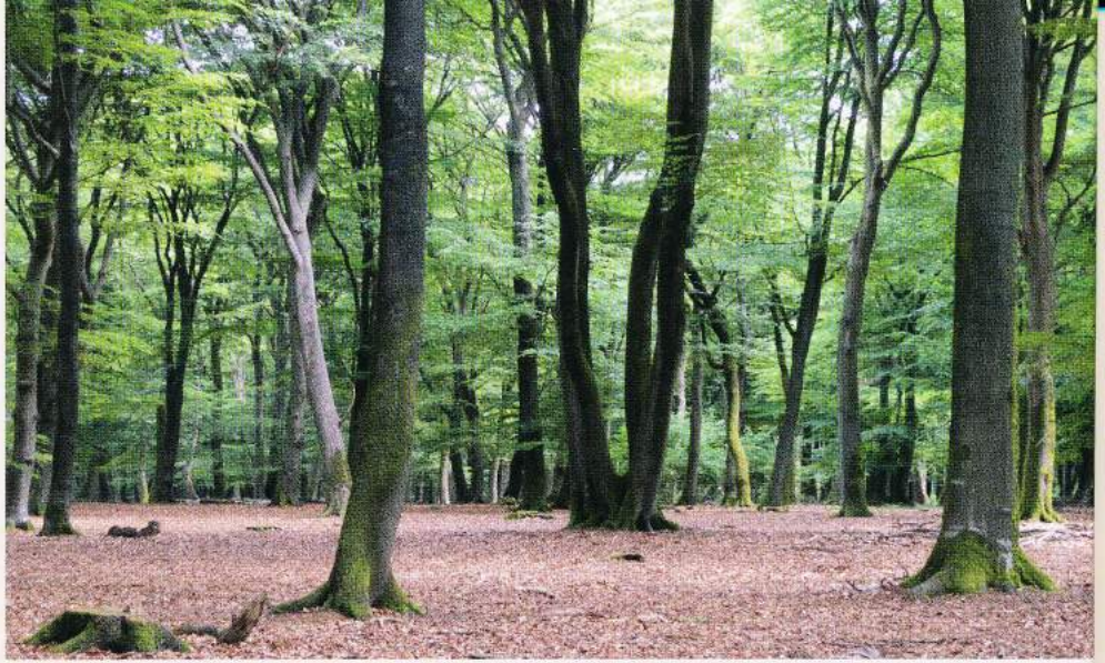
Zogenaamd 'beukenboombos' binnen het Elspeterbos (Veluwe). De opgaande beuken ( Fagus sylvatica ), zomereiken ( Quercus robur ) en wintereiken ( Quercus petraea ) in dit malenbos zijn merendeels op te vatten als spaartelgen van voormalig hakhoutbos. Door het slecht verteerbare blad en wilddruk is er nauwelijks sprake van kruidenbegroeiing.

Eichhorn, K.A.O., 2013. Maatregelenplan bosflora Gelderland. Rapport EE-1302. In opdracht van de Vereniging Natuurmonumenten. Eichhorn Ecologie, Zeist.