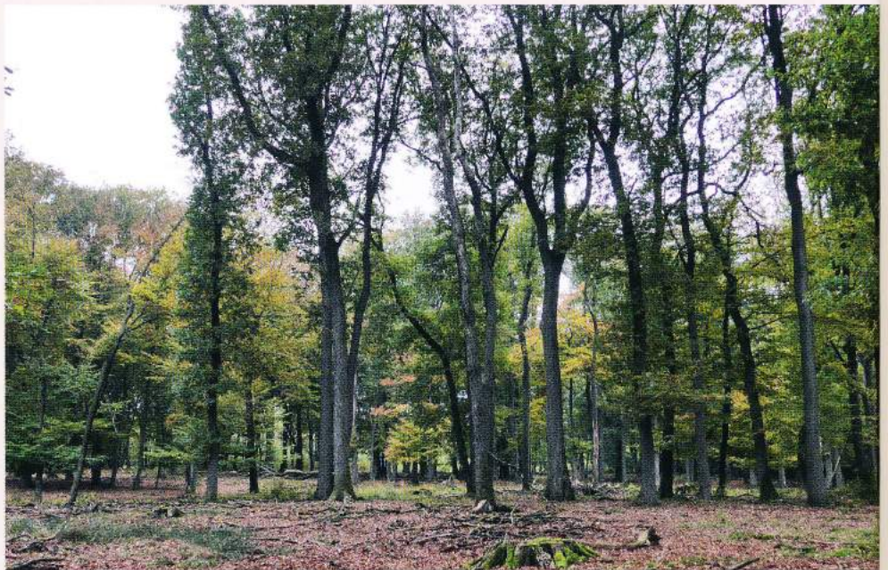
Een vrijgestelde groep oudere wintereiken ( Quercus petraea ) in het Elspeterbos. In oud beukenbos komt de eik als lichtminnende boomsoort in de knel. Vrijstellingsbeheer kan succesvol zijn om eiken, die uitzonderlijk oud kunnen worden, te bevoordelen (foto: Bert Maes).

In het beukenboombos hebben beuken vaak verdikte stamvoeten of zijn meerstammig wat wijst op hun hakhoutverleden (foto: Bert Maes).