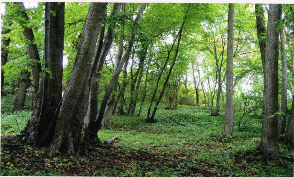
Akker en bufferzone van niet-wilde bomen en struiken tegen de oude bosrand van het Savelsbos. Hierdoor komen bovendien allerlei lichtvragende wilde bomen, struiken en kruiden in de oude bosrand in de knel.

Savelsbos op de Riesenberg met uitgegroeide hakhoutstoven van zeldzame winterlinde ( Tilia cordata ). Op de achtergrond een oude meerstammige stoof van een Spaanse aak ( Acer campestre ).