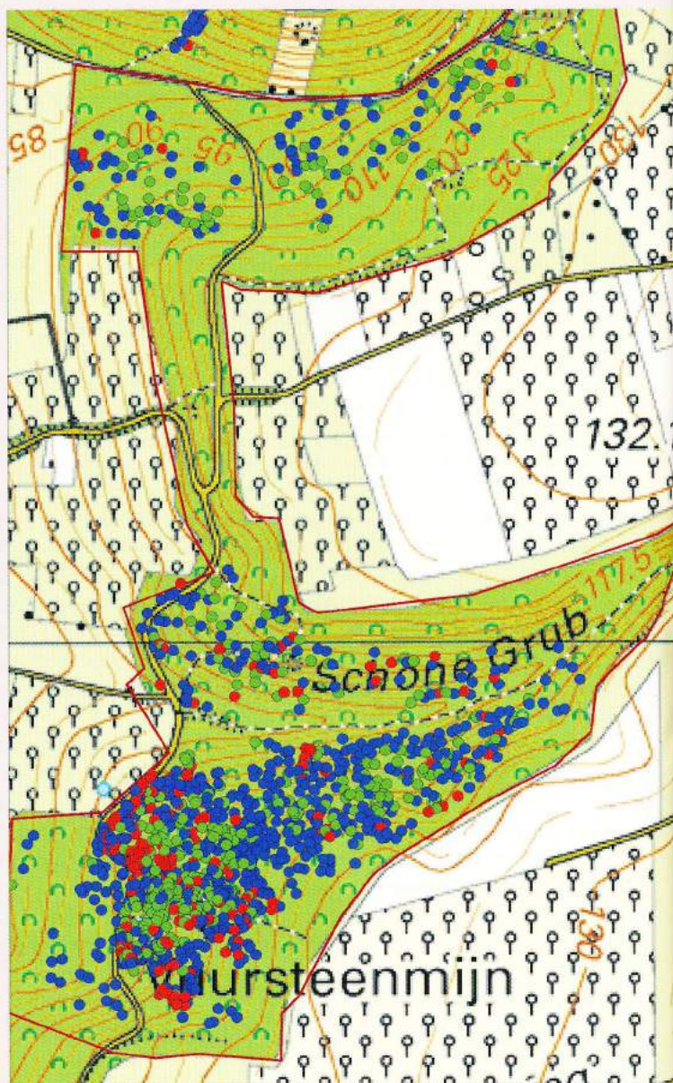
Kartering Ecologisch Adviesbureau Maes.

Veel van de in tabel 1 genoemde bijzondere en veelal kwetsbare soorten zijn lichtminnende soorten. Deze komen in de knel, doordat bossen steeds donkerder worden (Savelsbos: Willers et al., 2012 en Veluwe: Rövekamp & Maes, 2002). Tevens belemmert lichtgebrek de kiemingsmogelijkheden van deze soorten. Lichtgebrek is ook in een groot deel van de bosrand recent toegenomen door de aanleg van boomrijke bufferzones die bovendien uit niet-wilde bomen en struiken bestaan (Savelsbos). De oplossing is o.a. gelegen in het omvormen van bufferzones (Savelsbos), het vrijstellen van groepen winter- en zomereiken in het bos (Veluwe, habitattypen beuken-eikenbossen met hulst), selectieve kap (Savelsbos en Veluwe) en het stoppen met het oogsten van eiken (Veluwe). Veel kan al bereikt worden door niet-inheemse