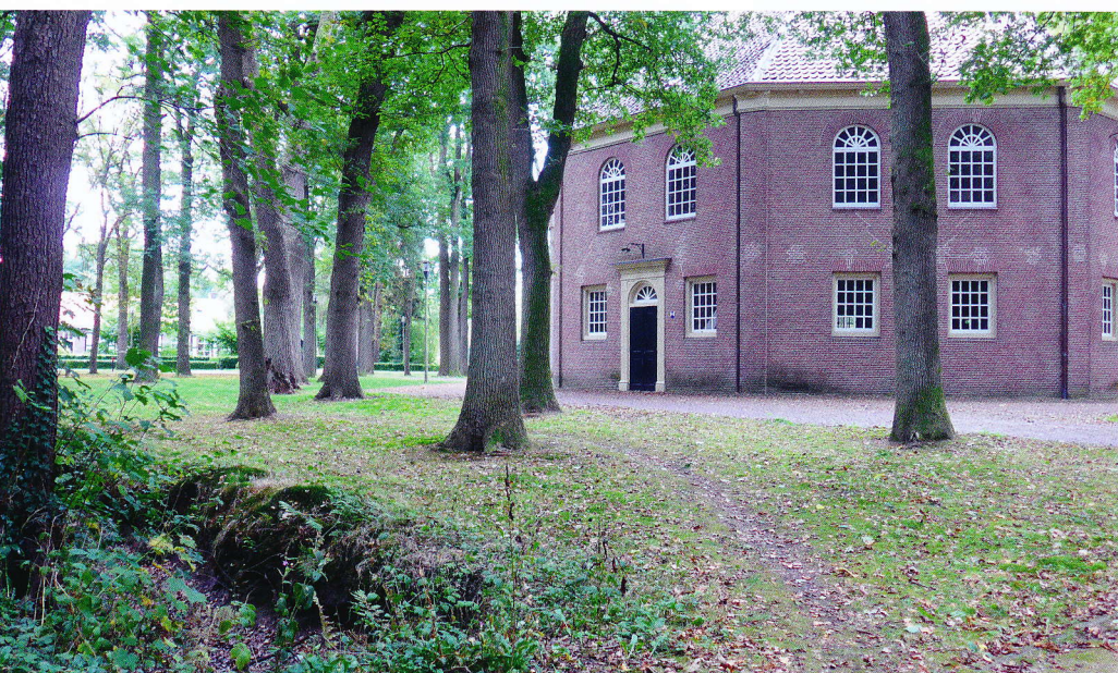
Monumentale beplanting van zomereiken, deels nog uit de bouwtijd van de koepelkerk van 1825 te Veenhuizen.