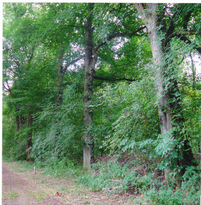
Laanbeplanting met zeldzame fladderiepen uit ongeveer 1880, Ommerschans.

W oeste gronden waren het, veen- en heidegebied. En juist op deze woeste gronden werden vanaf 1918 de Koloniën van Weldadigheid opgericht. Zeven zijn er in totaal, verspreid over ons land van Drenthe tot Vlaanderen. Het waren landbouwkoloniën die dienden om de armoede te bestrijden, want die was groot aan het begin van de 19e eeuw. Idee was om het veen en de heide te ontginnen en om te zetten in landbouwpercelen, wegen en bebouwing. Dit zou de mensen 'verheffen' én gelijk voor voedsel zorgen.