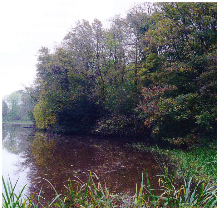
Fortgracht van de Ommerschans met deels bomen uit de schansperiode zoals fladderiep, es, zomereik, zwarte els en eenstijlige meidoorn.

De bijzondere waarde van de Kolonielandschappen zit in het rechtlijnige landschap van armoedebestrijding, gestoffeerd met monumentale gestichten, koloniehuisjes, beplanting, landbouwgrond en bossen, alles gericht op het vormen van de kolonisten. Hier vormde de mens het landschap, maar ook het landschap de mensen. In de zomer van 2018 wordt duidelijk of de Koloniën daadwerkelijk de status werelderfgoed krijgen.