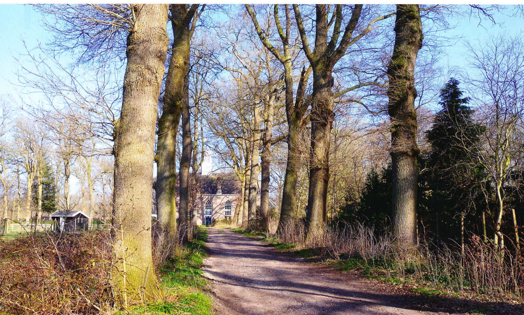
Het kerkelaantje uit circa 1845 met monumentale zomereiken, Ommerschans.