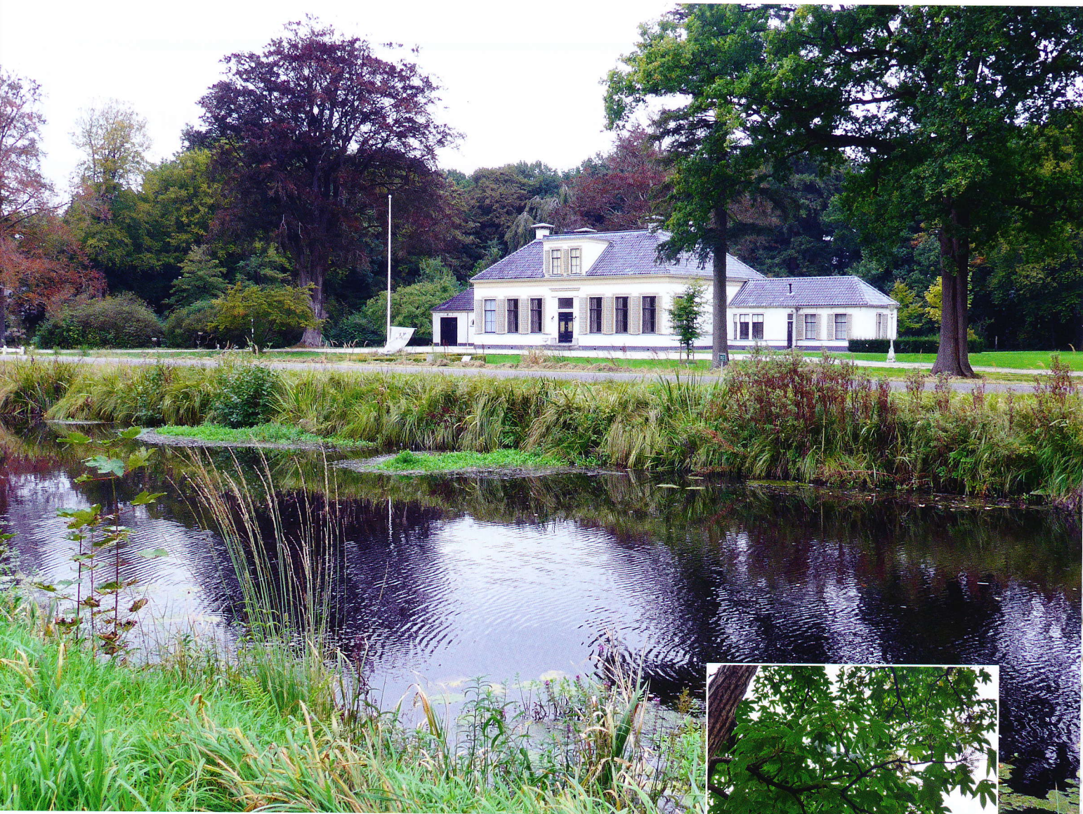
De directeursvilla (Klein Soestdijk) uit 1859 van Veenhuizen met bruine beuk uit de bouwtijd. Inzet: Een zeldzame Castorolieboom ( Kalopanax septemlobus ) in de zogenaamde Overtuin van Klein Soestdijk.