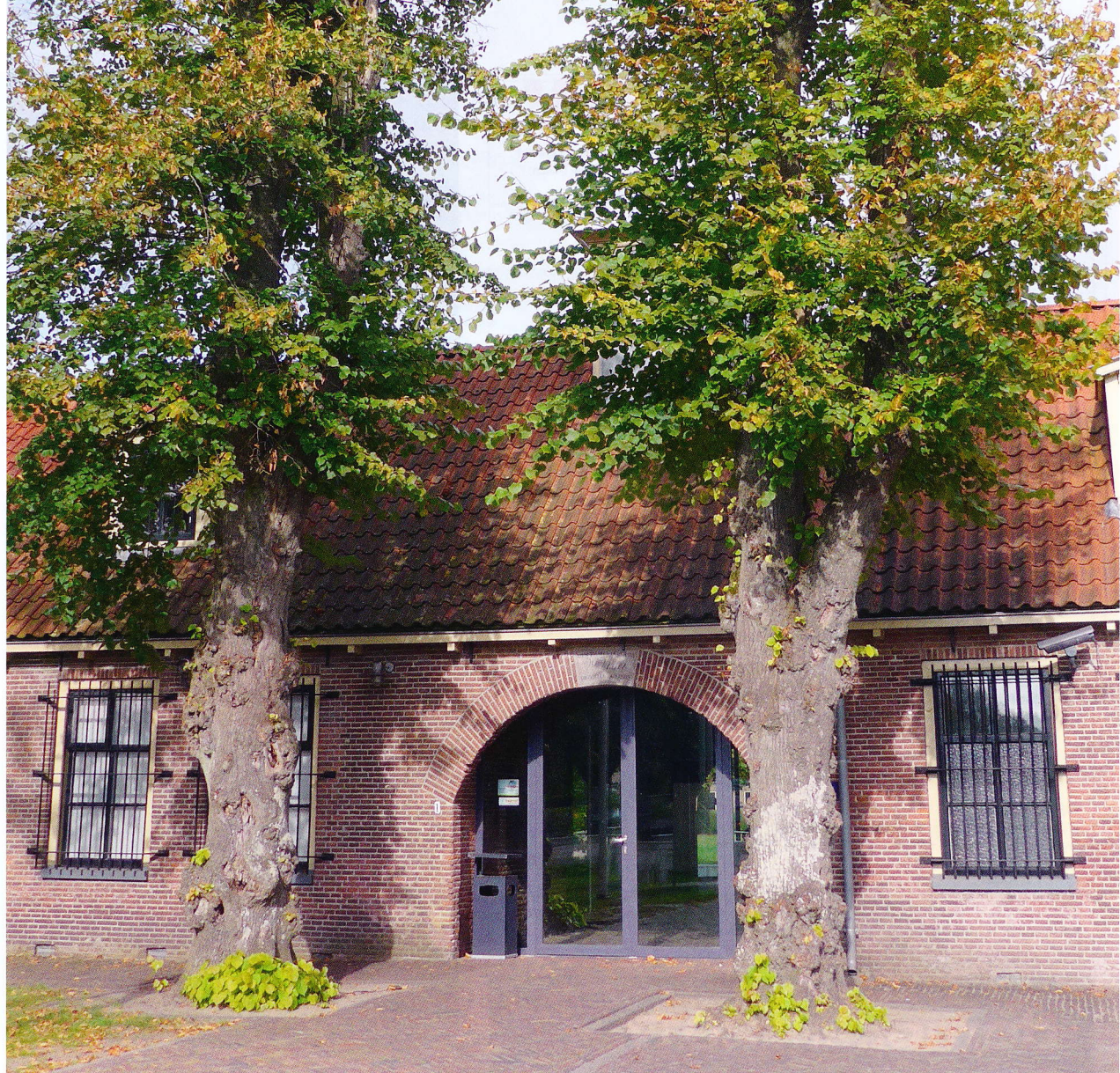
Twee Hollandse lindes bij de ingang van het centrale gebouwencomplex van kolonie Veenhuizen. Het betreft een 18e of 17e eeuwse variëteit.