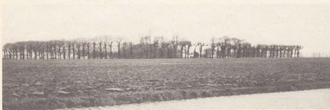
Groningen: Rottum Boerderijterp met vele snoeilinden als windkering

Ook in Friesland hebben de linden in het vlakke land een bakenfunktie. De mooiste en oudste bomen zoeken we hier echter in het hoger gelegen keileemgebied van Gaasterland. Bekend zijn de stadjes Balk en Sloten met historische bebouwing langs de grachtjes met aan weerszijde markante snoeilindenrijen. Brinken of dorps-