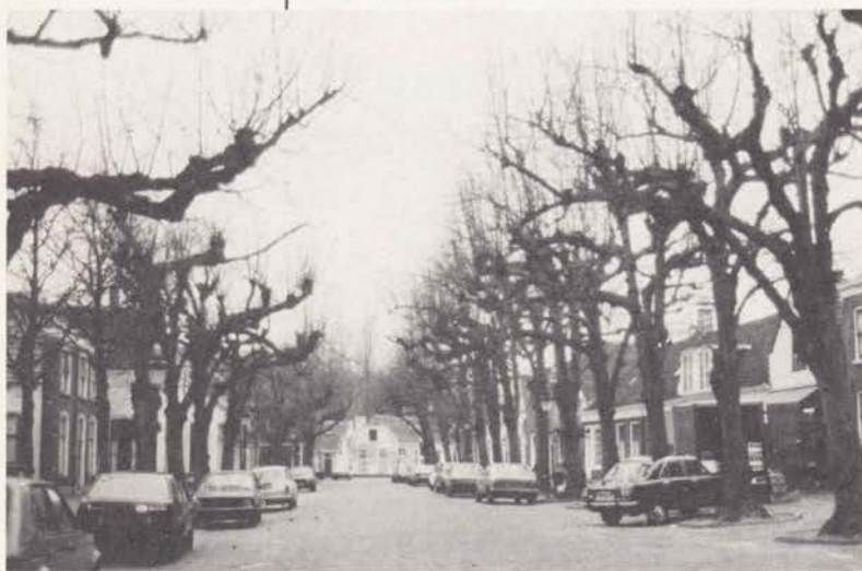
Zuid-Holland: Voorschoten Dorpsbeeld met snoeilinden

Ook Zuid-Holland heeft een oude traditie op lindegebied. Van Den Haag zijn vermeldingen bekend uit de 16e eeuw van aanplant op de Vijverhof. De - al door Huijgens bezongen - Korte en Lange Voorhout hebben vele linden. In Den Haag worden nog steeds overal linden aangeplant langs de straten en grachten. Den Haag kan als een goed voorbeeld gelden van een stad die veel zorg besteedt zowel aan het oudere bomenbestand als aan de jonge aanplant. De veelal venige bodem maakt het in deze stad soms extra moeilijk om een goed groeimilieu te scheppen. Het 17e eeuwse land