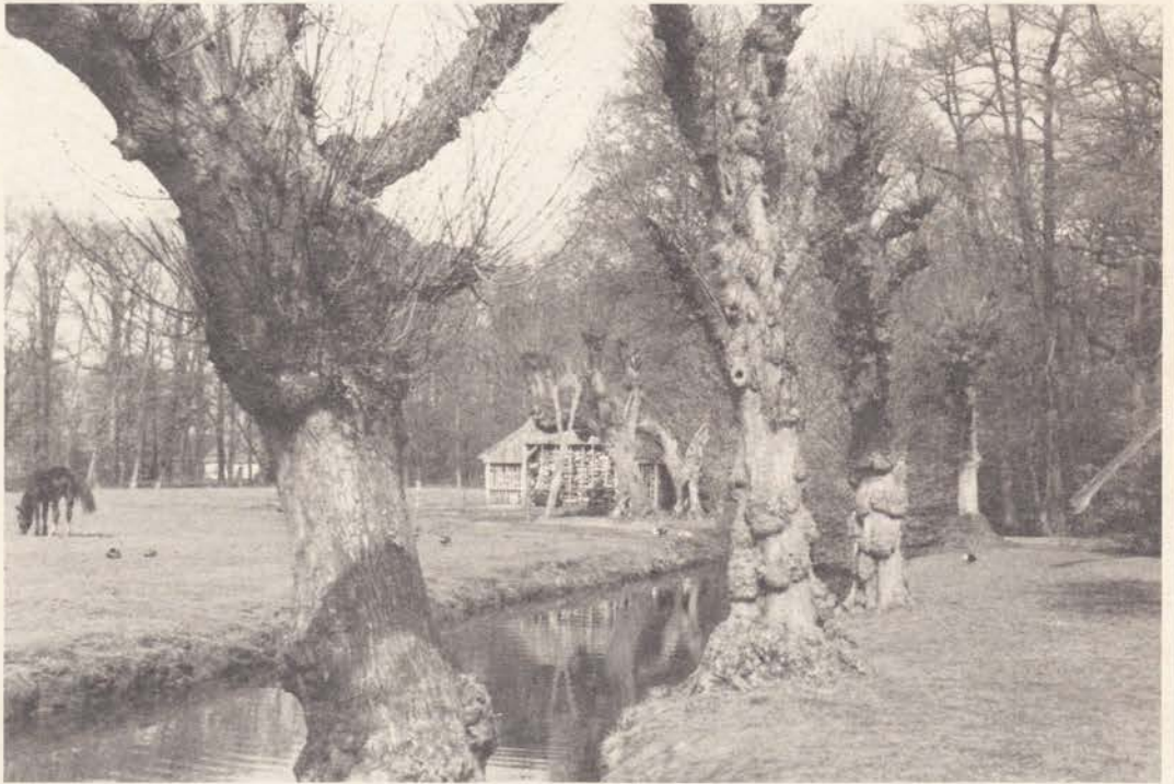
Overijssel: Havezathe Everloo Langs de kasteelgracht staan snoeilinden met een gemiddelde doorsnede van ongeveer zestig centimeter. De leeftijd wordt geschat op 250 jaar.

Het landelijk gebied van Overijssel heeft veel te bieden op lindegebied, vooral langs de IJssel en in de beekdalen. Vermeldenswaardig is Twente waar de inheemse winterlinde nog geregeld in