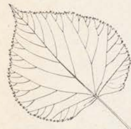
Tilia x vulgaris Hollandse linde

vermoedelijk twee klonen, de Koningslinde ( Tilia vulgaris 'Pallida') en de Zwarte linde ( Tilia vulgaris 'Zwarte linde'). In de 19e eeuw komen er andere typen bij. Daarnaast komen als minder algemeen in parken en als straat- en laanbeplantingen ook zilverlinde, Krimlinde en Amerikaanse linde voor. In totaal komen er op het noordelijk halfrond in de gematigde zone ca. 50 lindesoorten voor. In botanische tuinen en parken zien we wel eens bijzondere soorten, kruisingen of variëteiten. Met name de botanische tuinen van Utrecht en Wageningen bezitten aardige Tilia -collecties met Aziatische en Amerikaanse lindesoorten.