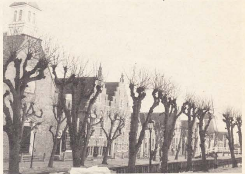
Friesland: Sloten Historisch dorpsbeeld met circa tachtig jaar oude leilinden langs de gracht

Groningen kent diverse grotere en kleinere landgoederen, zoals de Ennemaborgh, waar de linde een rol speelt. Opmerkelijk is de Havezathe in Wedde met oude snoeibomen langs een gracht. Tenslotte noemen we de stad Groningen waar, naast fraaie bomen in de parken, ook onlangs interessante pogingen zijn gedaan, om in het historische stadsdeel linden te planten om