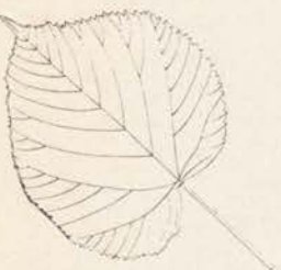
Tilia platyphyllos zomerlinde