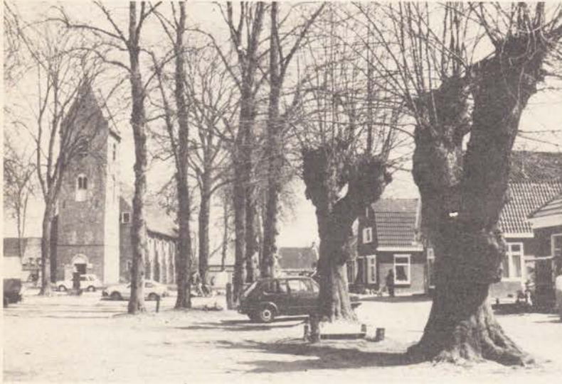
Drenthe: Norg Brink met fraaie lindenbeplanting

twijfeld op de buitenplaatsen en 'Staten' van Friesland. Schitterende voorbeelden zien we op Wickel, Martenastate, Harstastate, Klinze en Ypeystate. Op Klinze staat bij het 19e eeuwse landhuis de oudste linde van Friesland, de leeftijd wordt geschat op 300 jaar, de omtrek be-