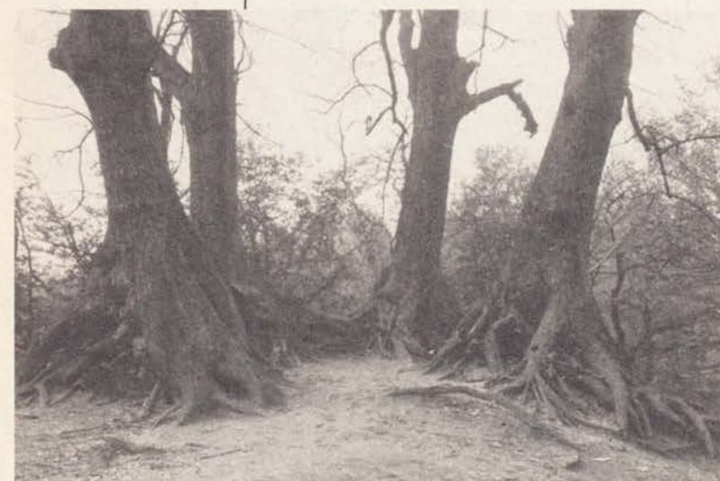
Kopse Hof bij Nijmegen. Lindengroep op een heuvel. Vrijgekomen wortels door erosie.

Zoals gezegd is de linde die we algemeen van onze steden en dorpen kennen de Hollandse linde ( Tilia x vulgaris ). Tenminste vanaf de 17e eeuw is deze linde gekweekt en verhandeld. Bekend is, dat duizenden gekweekte boompjes in de 17e eeuw naar Engeland verscheept werden. In Engeland bestaan nog steeds lanen uit die tijd. In ons land is vermoedelijk de laatste lindelaan uit die tijd in 1961 gekapt in Haarlem, de Spanjaardslaan! Wel zijn er nog een aantal oude solitaire bomen op dorpspleinen, boerenerven en landgoederen bewaard gebleven.