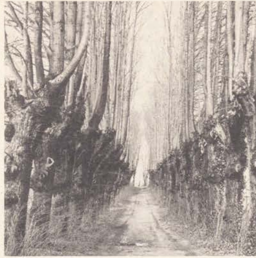
Snoeilinde laantje op de Kopse Hof

met parkbossen, waar lindelaneen zijn aangeplant en die deels een onderdeel van het bos vormen. Deze bostypen zijn vrij zeldzaam en hebben vaak stinseflora. We noemen Mariënwaard, Zoelen en 's Heerenberg. Enkele veelal nog gaaf bewaard gebleven historische rivierdorpen en -stadjes hebben snoeilindebeplantingen: