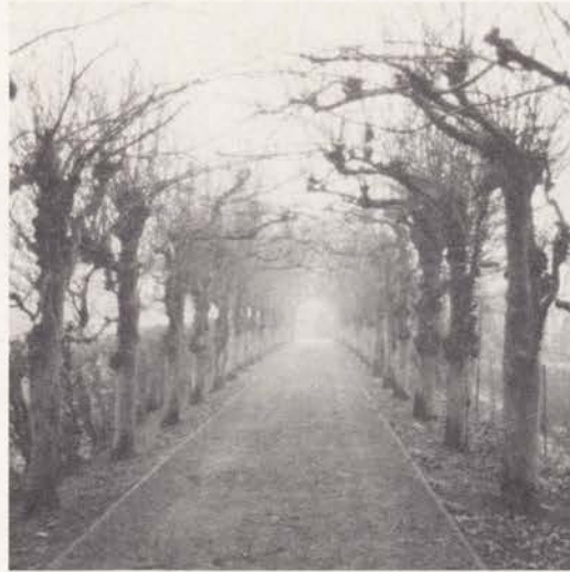
Zeeland: Aardenburg Lindenberceau

lindebomen o.a. in de Zandstraat en bij het kasteel Boxmeer. Andere eeuwenoude linden staan in Rosmalen, gespaard in een nieuwe wijk, in Tilburg achter de neogotische kerk van de Heikant, in Haaren bij kasteel Nemelaer waar