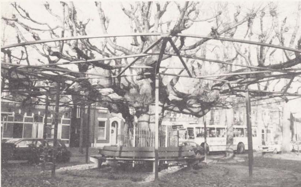
Noord-Brabant: Oisterwijk In het lindenrijkste dorp van deze provincie staat deze etagelinde van ruim 300 jaar oud

Landgoederen in Brabant met linden liggen vooral ten zuiden van Den Bosch aan de benedenloop van de Dommel: Reewijk in Vught, Haanwijk en Zegenwerp in St Michielsgestel,